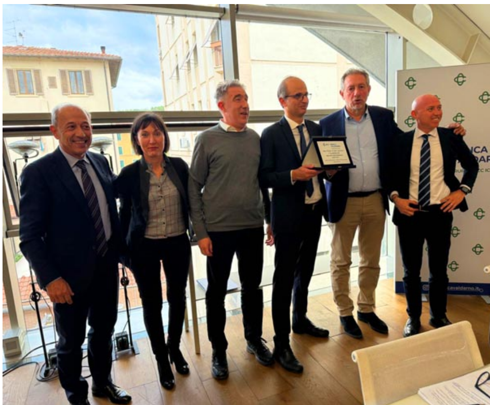
FILIALE DI SAN CIPRIANO

DURANTE LA SEDUTA DEL CONSIGLIO DI AMMINISTRAZIONE DI MERCOLEDÌ 9 APRILE 2025, SONO STATI CONSEGNATI I RICONOSCIMENTI AI COLLEGHI DELLA FILIALE DI SAN CIPRIANO E DEL SERVIZIO CREDITI.