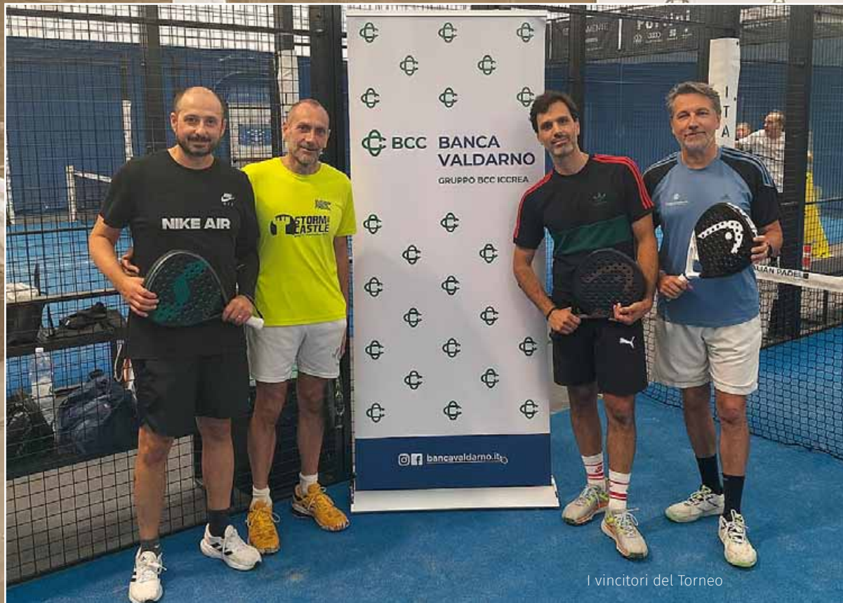
I vincitori del Torneo