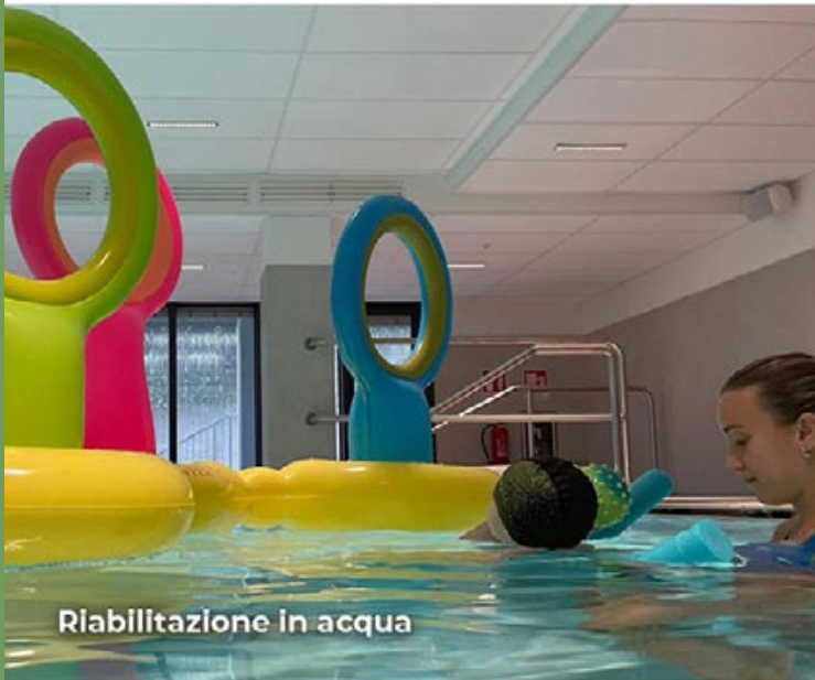
Riabilitazione in acqua

Aiutaci a scegliere il progetto TOG da sostenere!