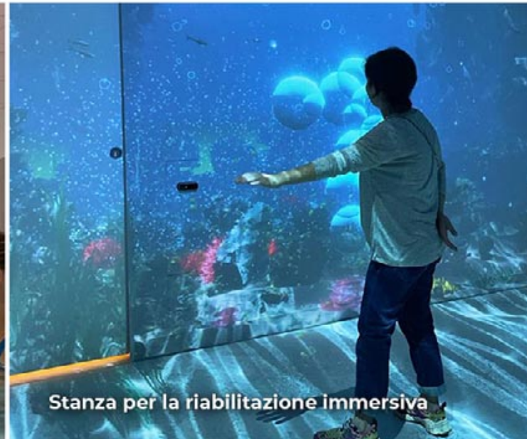
Stanza per la riabilitazione immersiva